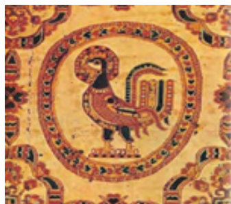
تصویر ۸. نقش خروس در پارچه ساسانیان (صابری و مافی تبار، ۱۳۹۹: ۸)