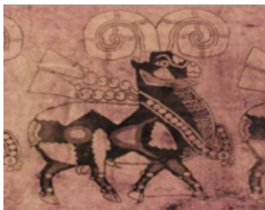
تصویر ۱. نقش قوچ در پارچه ساسانی (شجاعی قادیکلایی و مراثی: ۱۳۹۷، ۸۰).

مدالیون ۱ قرار دارد و قسمت پایینی پاها با مروارید آرایش شده است. می‌توان دریافت که ترکیب‌بندی کلی طرح پارچه به صورت افقی است و تکرار نقوش به صورت ردیفی منظم شده است (تصویر ۱).