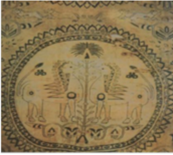
تصویر ۳. پارچه ابریشم ساسانی با نقش شیر (طالب‌پور، ۱۳۹۴: ۶۰).