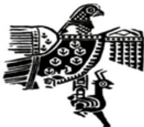
تصویر ۵. نقش عقاب در پارچه ساسانی (صادق‌پور فیروزآباد، ۱۳۹۶: ۱۰۹).