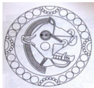
تصویر ۴. نقش سرگراز در پارچه ساسانی (جلیلی، ۱۳۹۲: ۱).

ساسانی می‌توان از عقاب، طاووس، خروس و مرغابی نام برد. در طرح آن‌ها به زیبایی ظاهری آنان و ارتباطی که با ایزدان دارند توجه شده است (جدول ۲).