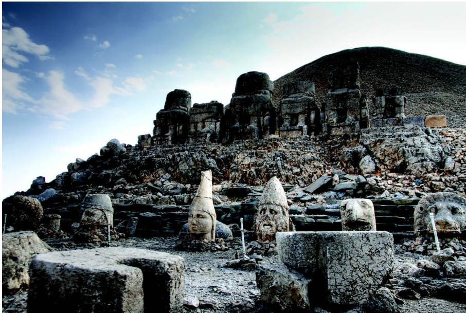
تصویر ۴. خدایان کمازن (Adrych, et al, 2017: Fig. 6.1)

که اغلب آتیس، پاریس ۳ و به‌ویژه میترا در غرب به سر دارند. بر پیشانی او، متمایز از تاج، یک دیهیم تزئین شده با دایره‌هایی چند قرار دارد. از پشت سر او پرتوهایی می‌درخشد که او را به‌عنوان خدای خورشید معرفی می‌کند. چهره او جوان است و بی‌ریش و با چشمانی درشت. نویسندگان در ادامه به دیگر نقش‌های «آپولو-میترا-هلیوس-هرمس» می‌پردازند و آنها را در مکان‌هایی چون سامسات ۴ در آدیامان ترکیه و سفراز کوی ۵ و زوگما ۵ بررسی و ارزیابی می‌کنند و از سبک آنها سخن می‌گویند.