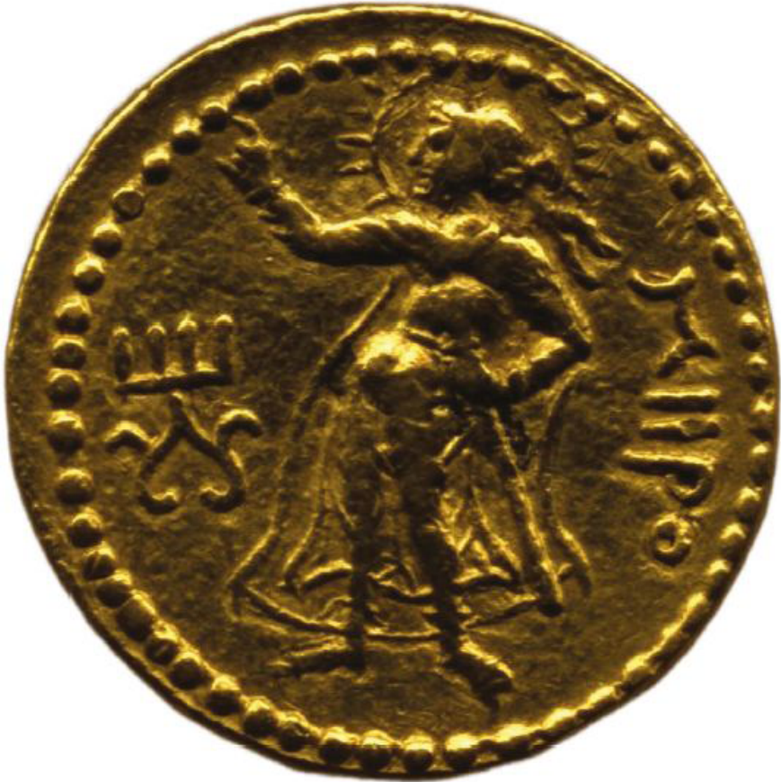
تصویر ۳. سکه زرین کائیشکا که میرو را نشان می‌دهد و در بلخ ضرب شده است (Adrych, et al, 2017: Fig. 5.1)

سرش آویزان است بسته شده است. او تونیک تنگ و شلواری به تن دارد - نمونه‌ای از تصویر کوچ‌نشینان آسیای مرکزی است - و زیر ردایی با دو قلاب بسته شده است. کمربندش نیام را نگه داشته است و با دست قبضه شمشیر را گرفته است و چکمه‌هایی به پا دارد. براساس پرتو درخشان گرداگرد سرش که صفت خدای خورشید است و نیز کتیبه‌ای که در سمت راستش است، میرو شناسایی شد (Adrych, et al, 2017: 106-107). فصل ششم این کتاب به آپولو-میترا در کماژن پرداخته است. نخستین بار در اواخر سده نوزدهم