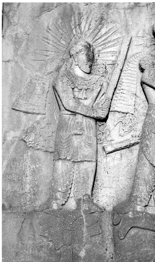
تصویر ۲. نقشی که نویسندگان آن را مهر پنداشته‌اند (Adrych, et al, 2017: Fig. 4.4)

می‌کنند که شاید گنجاندن مهر در این صحنه نمادین می‌تواند این باشد که تاجگذاری اردشیر در جشن مهرگان، روی داده است، اما چنین سخنی باید در حدس و گمان باقی بماند، زیرا هیچ گونه شواهد تاریخی دربارهٔ جزئیات به پادشاهی رسیدن اردشیر در دست نیست (Adrych, et al, 2017: 90). نویسندگان در ادامهٔ این فصل به نقش مهر در دین ساسانیان می‌پردازند و آن را تحلیل می‌کنند. فصل پنجم به نقش میرو در میان کوشانیان در سدهٔ یکم تا سدهٔ چهارم میلادی پرداخته است. در استان شمالی قلمرو کوشانیان یعنی بلخ، نام میرو شکل محلی میترا یا مهر است و خدای میرو در سدهٔ دوم میلاد نقش ارزنده و برجسته‌ای داشت. کوشانیان، میرو را در یک محیط نمادین پیچیده، هم بر سکه‌هایشان و هم در نیایشگاه‌های سلطنتی نقش می‌کردند. نویسندگان با پرداختن به مهر، او را با خدایان در پیوند با خورشید همچون سوریا هندی ۱ و هلیوس یونانی ۲ مقایسه می‌کنند. سکه‌ای زرین در زمان پادشاهی چهارمین فرمانروای کوشانی، کانیشکا (۱۲۷-۱۵۰) ضرب شده است که وزن آن ۷/۹۳ گرم و قطرش ۲۱ میلی‌متر است. تقریباً طلای ناب است و طراحی