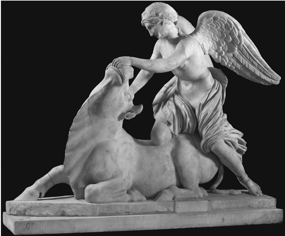
تصویر ۱. نیکه هنگام کشتن گاو نر، از ویلای آنتونوس پیوس، ایتالیا (Adrych, et al, 2017: Fig. 1. 6)

شاپور دوم حلقه‌ای را به دست اردشیر دوم می‌دهد درحالی‌که هر دو تن بر ژولیان شکست خورده ایستاده‌اند و نیز درحالی است که مهر به آن دو می‌نگرد. پرسشی را طرح می‌کنند که حضور مهر در این نقش برجسته را چگونه می‌توان تفسیر کرد؟ واگذاری اقتدار یا افتخار که نماد آن حلقه است، میراث دیرینه‌ای در هنر ایرانی دارد و نقشی رایج در نقش برجسته‌های صخره‌ای ساسانی است، اما گنجاندن مهر در این نقش برجسته نمایانگر نظارت مهر بر پیمان است. بنابراین اگرچه مهر در دیگر نقش برجسته‌های ساسانی دیده نمی‌شود، حضور او با توجه به این نقش چندان دور از انتظار نیست چراکه مهر در اینجا به پیمان میان دو پادشاه نظارت می‌کند. (Adrych, et al, 2017: 90). نویسندگان همچنین با احتمال و احتیاط پیشنهاد